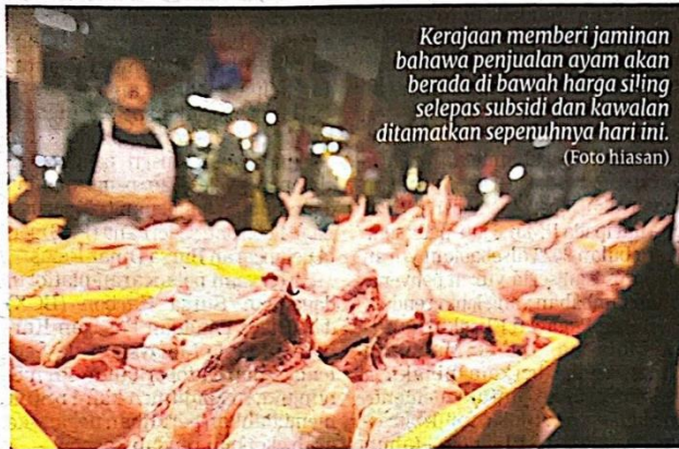
Kerajaan memberi jaminan bahawa penjualan ayam akan berada di bawah harga siling selepas subsidi dan kawalan ditamatkan sepenuhnya hari ini. (Foto hiasan)