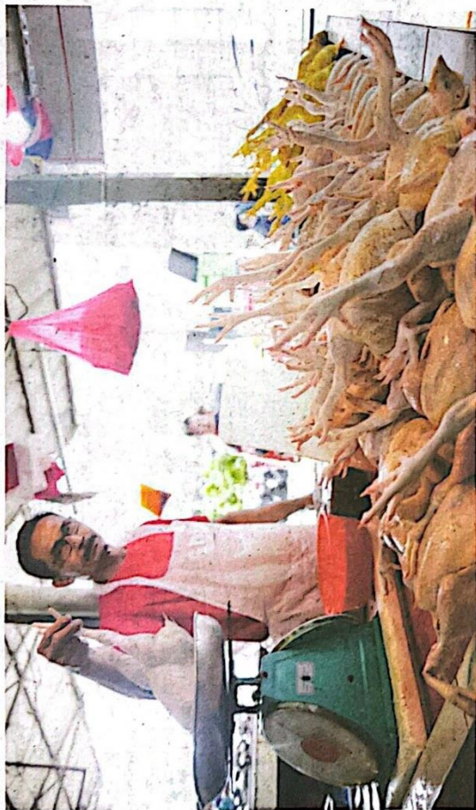
PELADANG, penternak, pemborong, peruncit dan pengguna sukar menjangkakan apa yang akan berlaku dalam tempoh terdekat selepas kerajaan menamatkan subsidi ayam berkuat kuasa hari ini.

"Apabila kos meningkat dan kalau kerajaan tidak masuk campur terutama dengan harga anak ayam dikuasai oleh kartel besar, penternak kecil dan sederhana ini akan terkesan. Penternak akan risau untuk masuk anak ayam di ladang, jadi pengeluaran ayam akan terjejas.