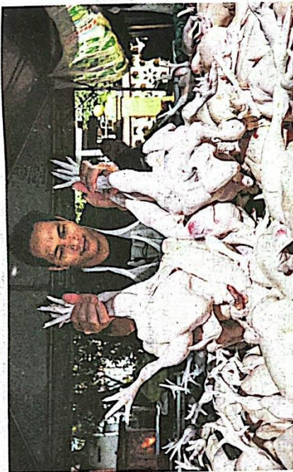
Kerajaan memberi jaminan tidak akan berfaku kenaikan harga ayam secara mendadak susulan langkah penamatan subsidi dan kawalan harga ayam berkuat kuasa hari ini.

Tetapi perlu diingat, apa pun langkah yang diambil, perlu dikuatkuasakan undang-undang perlu dilaksanakan dengan lebih tegas selain memastikan bekalan di