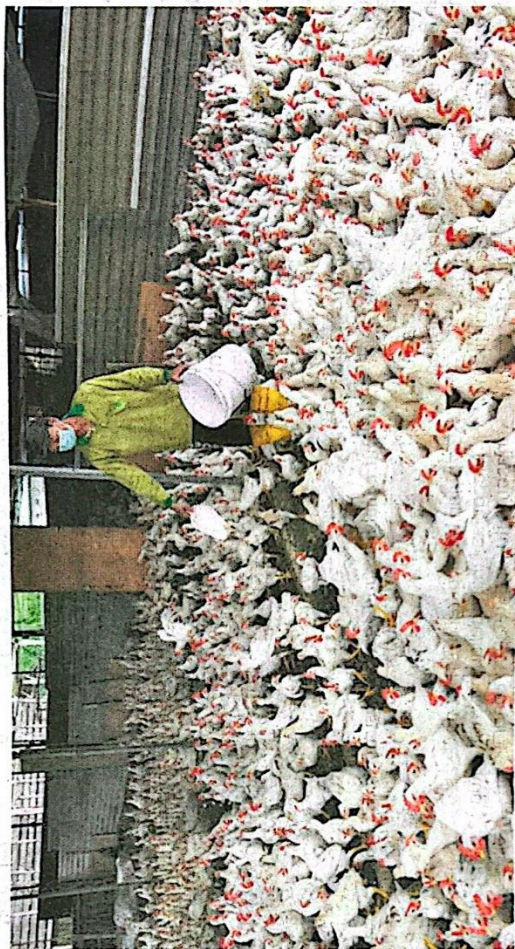
Pembiayaan disediakan Agrobank membolehkan penternak ayam menambah produktiviti dan mengurangkan kos, seterusnya berupaya menawarkan harga lebih baik kepada pasaran.

"Program ini juga membolehkan pengusaha beralih kepada teknik pemeliharaan yang lebih cekap dan secara tidak langsung dapat meningkatkan produktiviti ladang, mengurangkan kos pengeluaran selain harga ayam ber-