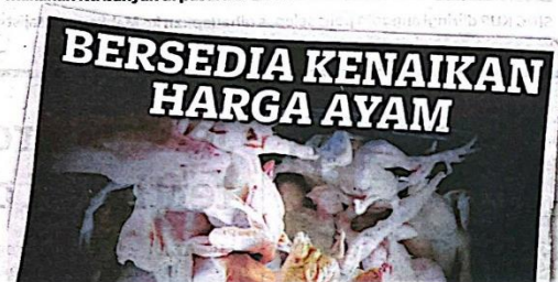
KERATAN muka depan Kosmo! semalam.

kan harga beras import. Adakah bila berlaku kenaikan harga ayam nanti, perkara sama berlaku?