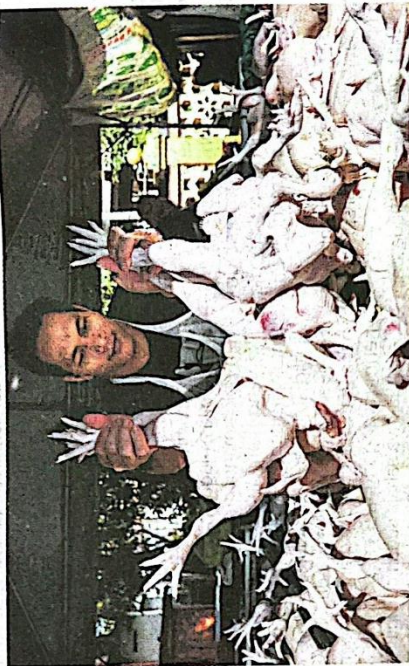
Kerajaan memberi jaminan tidak akan berfaku kenaikan harga ayam secara mendadak susulan langkah penamatan subsidi dan kawalan harga ayam berkuat kuasa hari ini.

Tetapi perlu diingat, apa pun langkah yang diambil, perlu dikuatkuasakan undang-undang perlu dilaksanakan dengan lebih tegas selain memastikan bekalan di