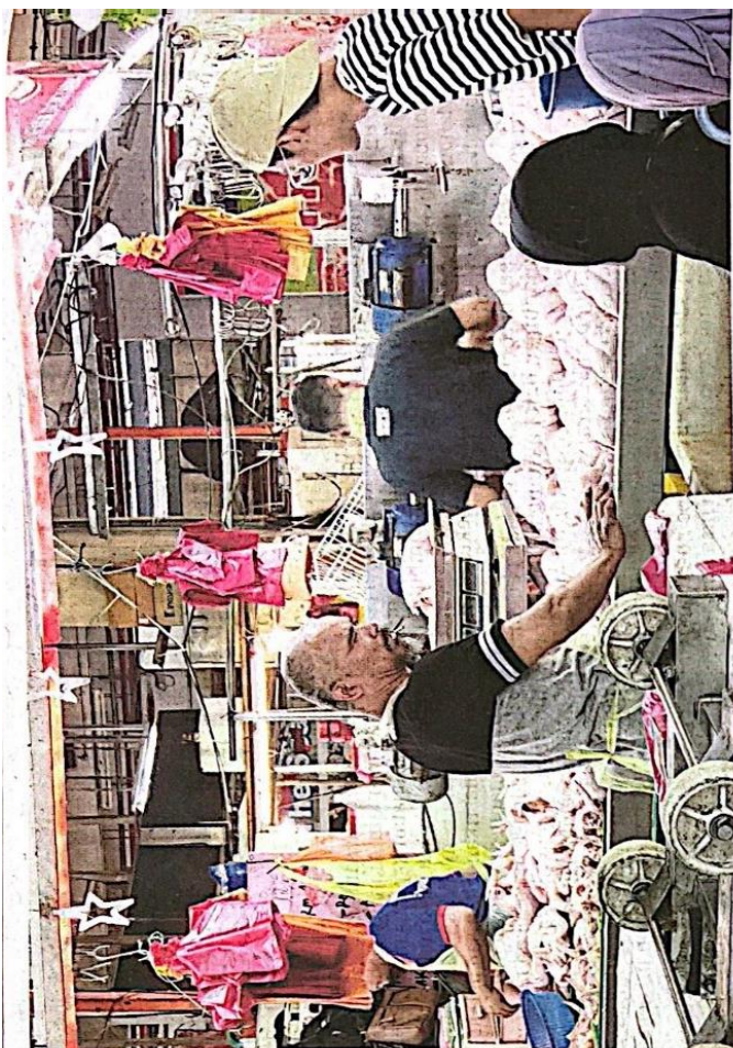
Tinjauan harga ayam mendapati harga turun sehingga RMI bagi setiap kilogram di Larkin, semalam.

Penurunan sehingga RMI bagi setiap kilogram berbanding RM10.50 sekilogram sebelum ini dikesan hasil pemantauan di beberapa pasar basah sekitar Lar-kin, Perling, Skudai dan Tam-poi, semalam.