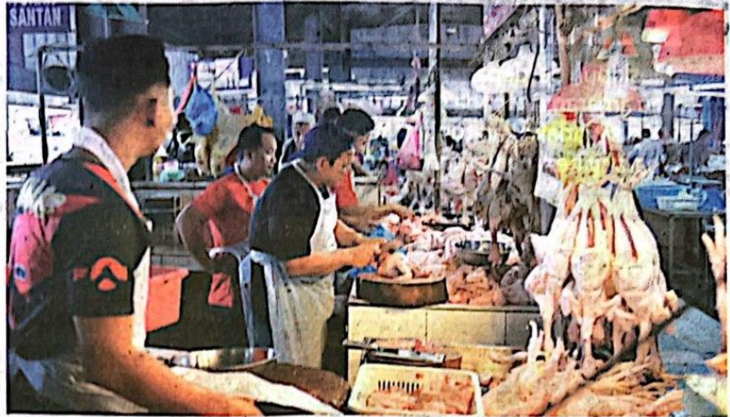
SEBAHAGIAN daripada peniaga ayam di Pasar Chabang Tiga, Kuala Terengganu, semalam.